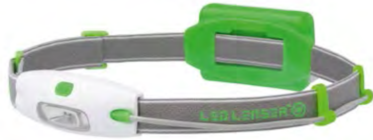
LED LENSER® NEO NEÓN VERDE: Artículo n.º 6111