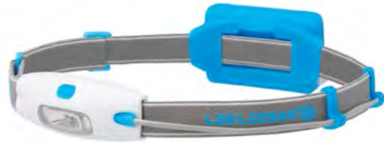
LED LENSER® NEO NEÓN AZUL: Art. n.º 6110