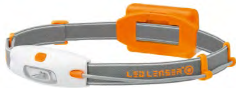
LED LENSER® NEO NEÓN NARANJA: Artículo n.º 6113