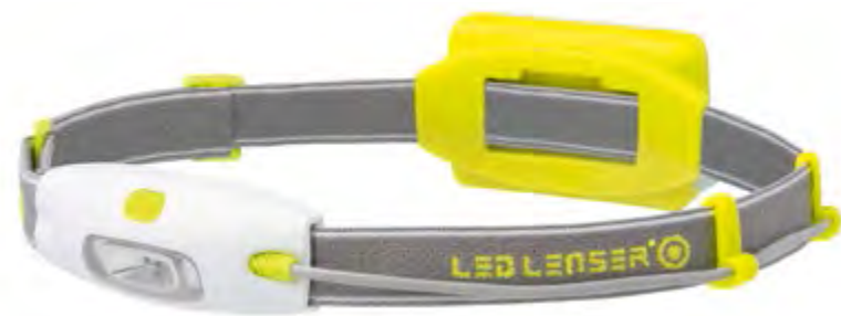
LED LENSER® NEO NEÓN AMARILLO: Art. n.º 6114