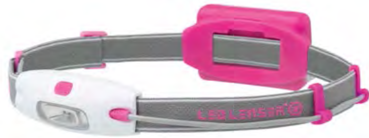
LED LENSER® NEO NEÓN FUCSIA: Art. n.º 6112